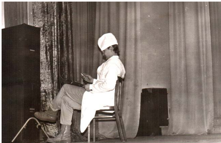
Сценка У доктора