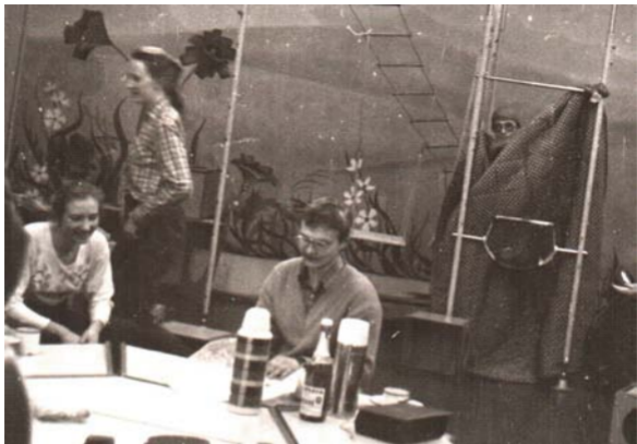
Творческие муки 1991