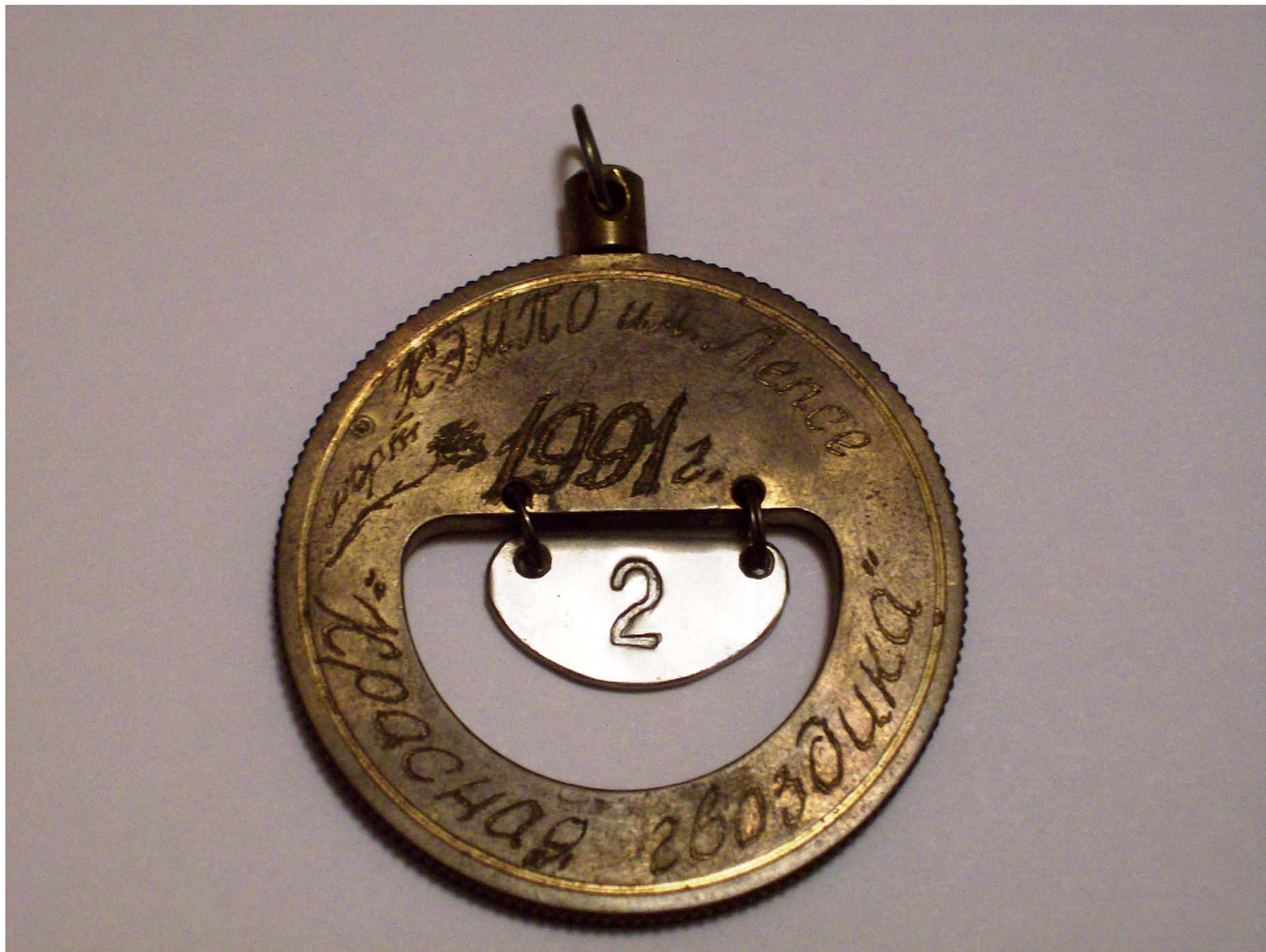
Медаль Участнику лыжного десанта Красная гвоздика - 1991 (на подвеске какой десант по счету)