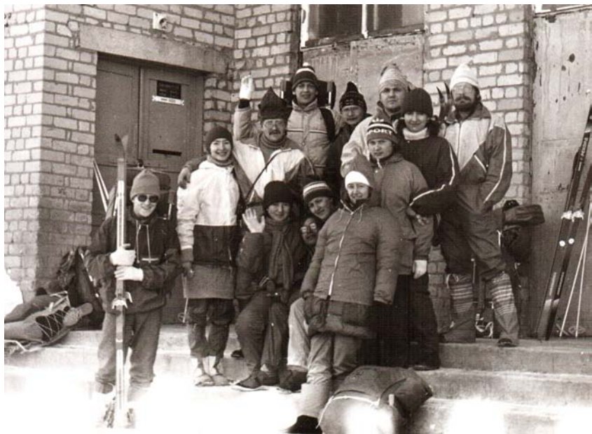
Лыжный десант КГ-1991