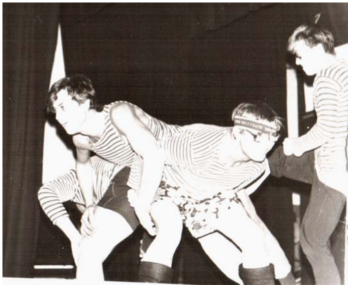
Часы с кукушкой 2