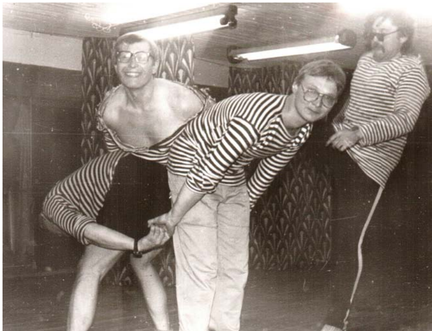
Часы с кукушкой 1